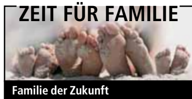
Familie der Zukunft